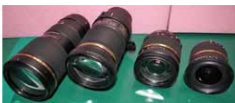
一眼レフカメラ用交換レンズ