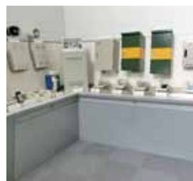
鉄道指令システム製品の検証作業中!