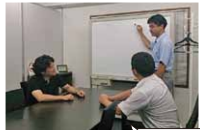
お客様の要望に いかに応えられるか。 作戦会議中！