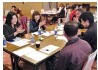
3月に八戸ユートリーで実施された、社員研修です

青森県三八上北地域に軸足を据え、グローバルに発信する企業です。 “ものづくりジャパン”の一員として夢と誇りを持てる方を期待いたします。