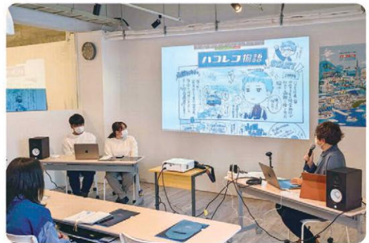
▲2023年2月18日に、デジタルハリウッドSTUDIO青森で開催されたWeb業界研究セミナー「目指せ 地域のWebクリエイター 学ぼう Webギョウカイ」の様子。

フロントエンドは、Webサイトやアプリにおいてユーザー側が目にする部分。周辺技術の進化に伴い、フロントエンドもどんどん高度になっていくなか、当社は役員以外フロントエンドエンジニアで構成されており、存分に力を発揮できるのが強みです。